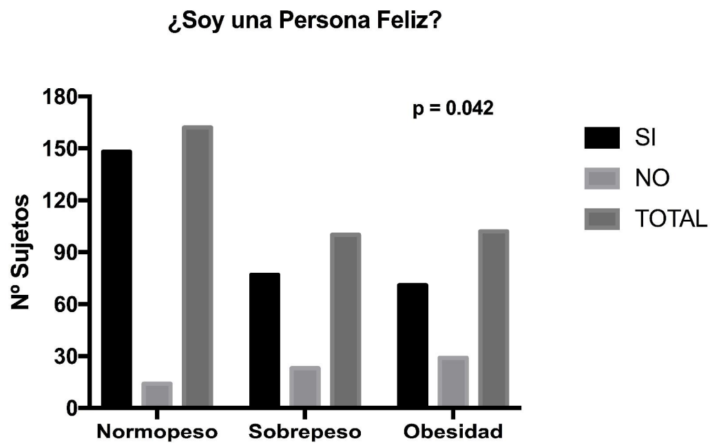
Figura 2. Proporción de escolares que responden de forma positiva y negativa.