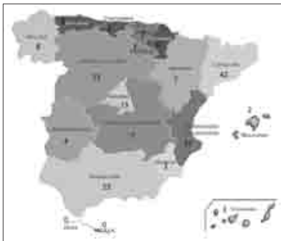
Fig. 1.—Distribución geográfica de los pacientes con NPD durante el año 2008.

2008 se muestra en la tabla II, en la que se evidencia el porcentaje ajustado por número total de hospitales en la provincia, siendo Cuenca y Salamanca los que mayor porcentaje de hospitales aplican este tratamiento.